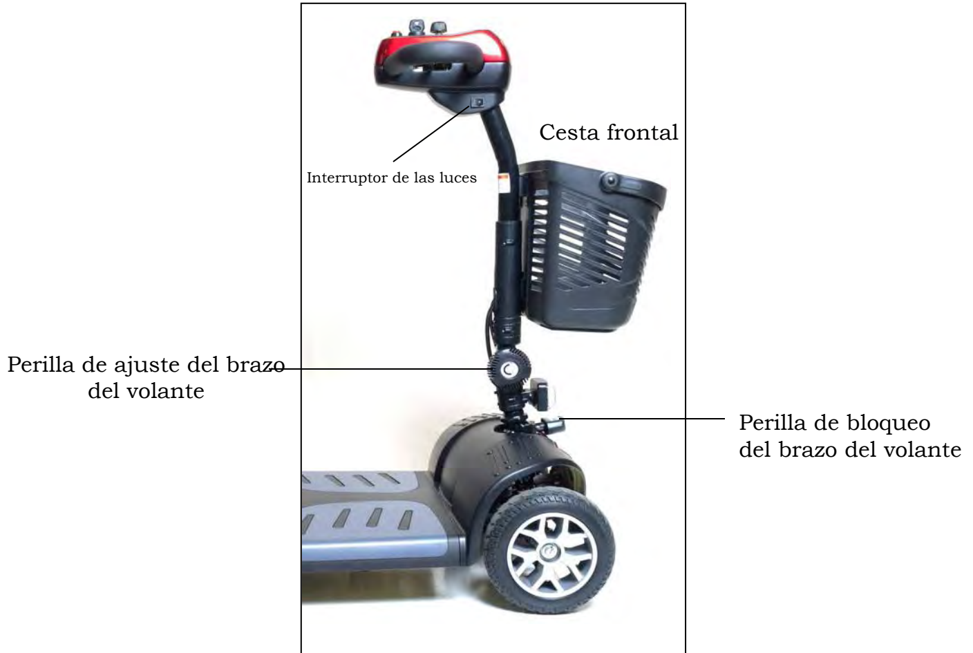
Imagen 22. Brazo del volante alzado