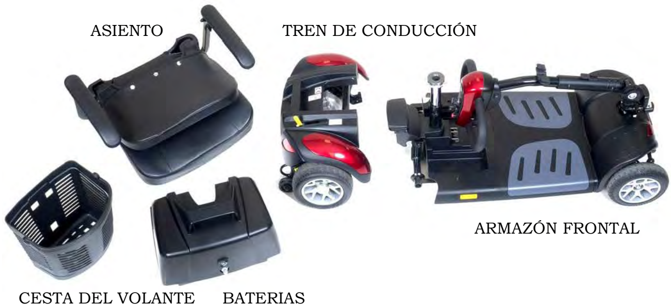
Imagen 18. Componentes del Buzzaround XL™ (Modelo GB147)

Asegúrese de que todos los componentes en el scooter hayan sido correctamente armados. Durante el montaje, por favor verifique que todos los positivos de conexión/bloqueo estén en su lugar.