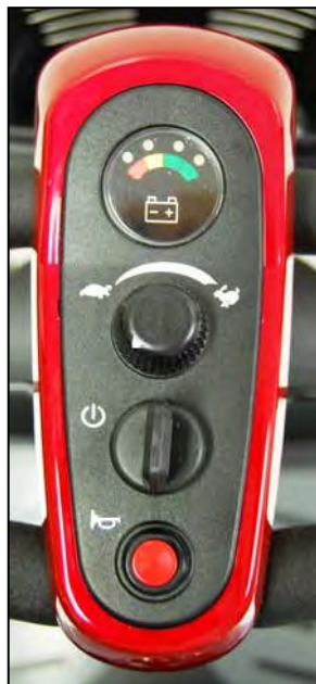
Imagen 12. Arranque (Apagado)