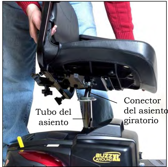
Imagen 23. Instalando el asiento