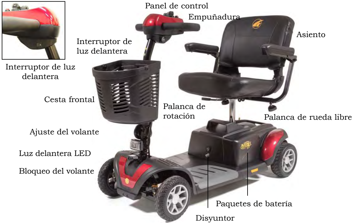
Imagen 4. Su Golden Buzzaround XL™ (Modelo GB147SHD)