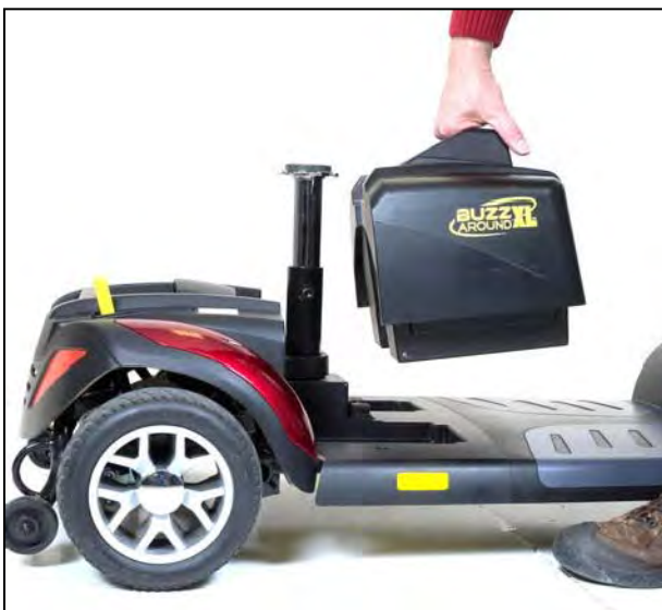
Imagen 21. Instalación de la batería