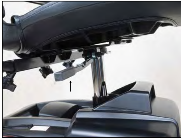
Imagen 8: Ajuste de rotación del asiento