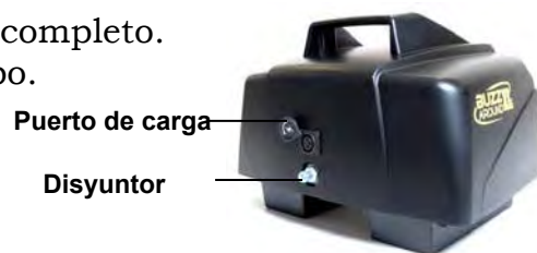
Imagen 25. Baterías