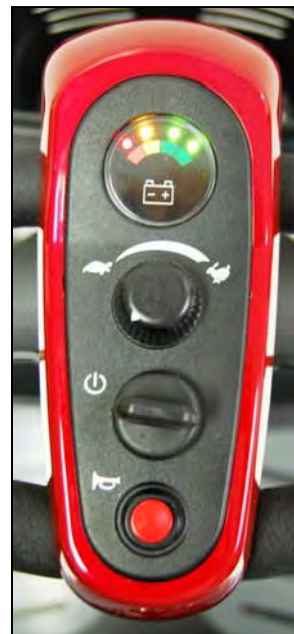
Imagen 13. Arranque (Encendido)