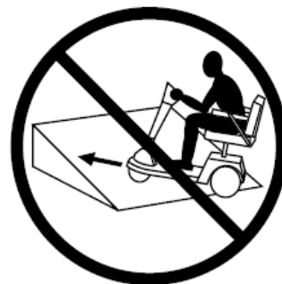
IMAGEN 3. CRUZANDO UNA CUESTA