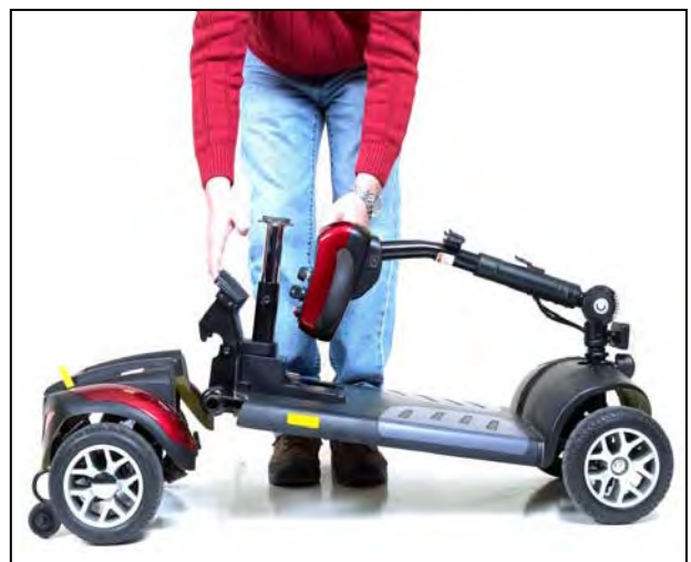
Imagen 20. Conectando el armazón y el tren de manejo