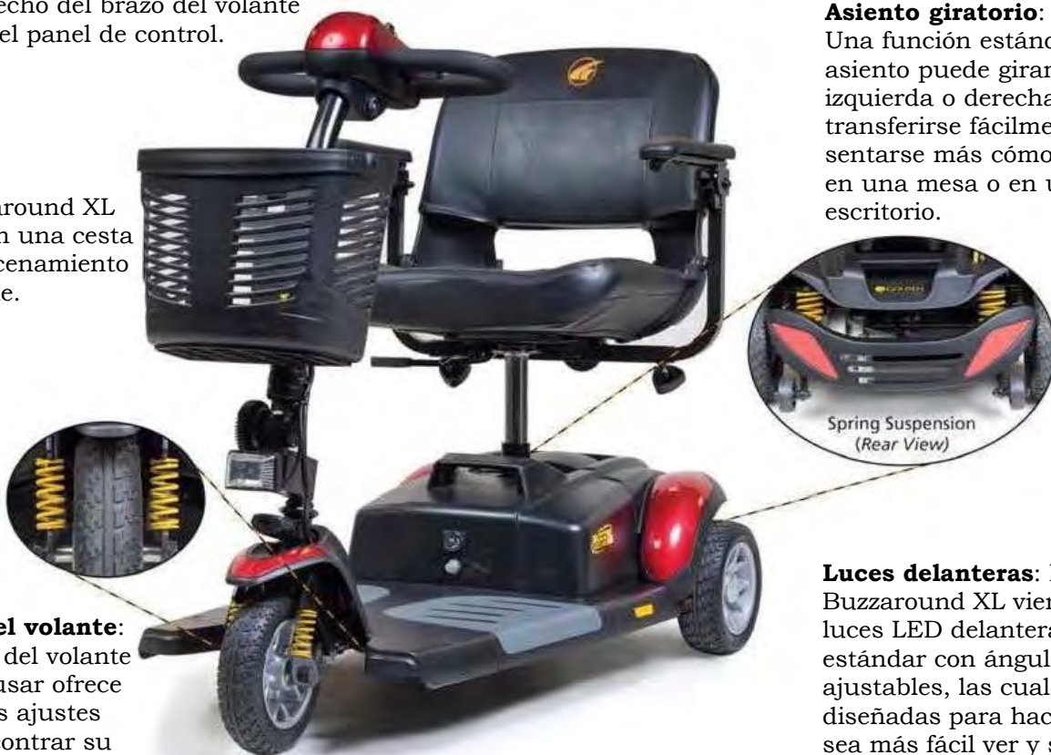
Imagen 1. Características del Buzzaround XL™ (Modelo: GB117S)

El Buzzaround XL viene con luces LED delanteras estándar con ángulo ajustables, las cuales están diseñadas para hacer que sea más fácil ver y ser visto.