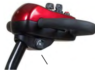
Puerto de carga

Nota: Su scooter no se moverá mientras el cargador permanezca conectado.