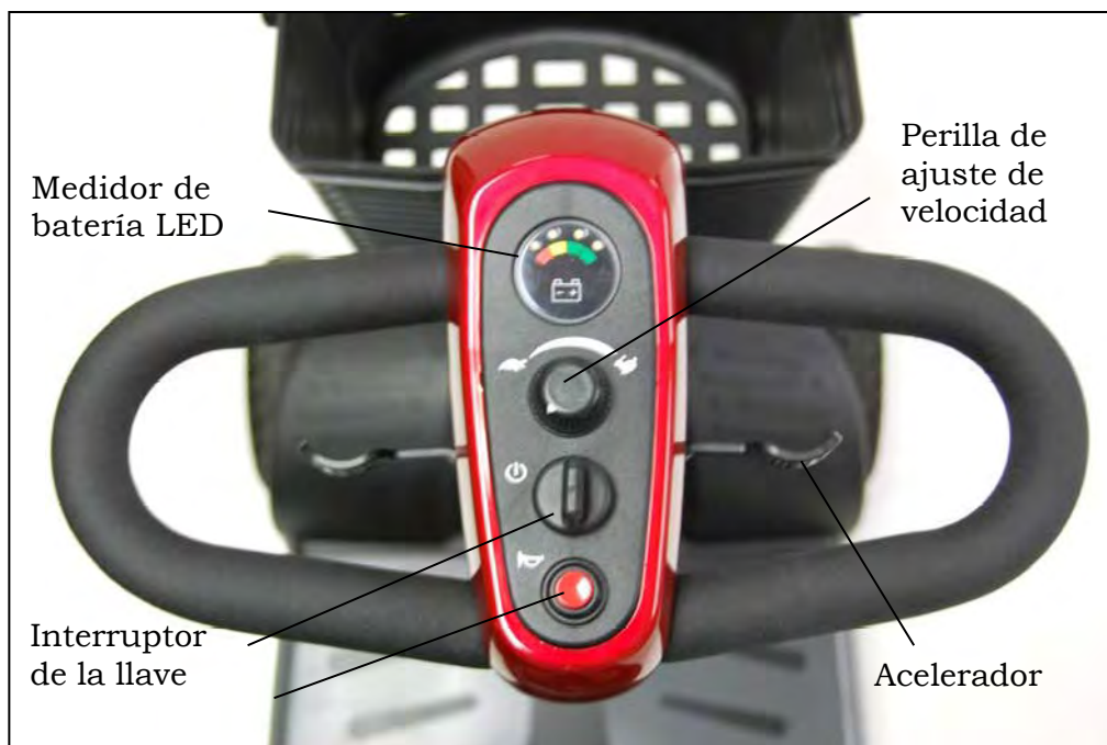
Imagen 5. Panel de control del brazo del volante