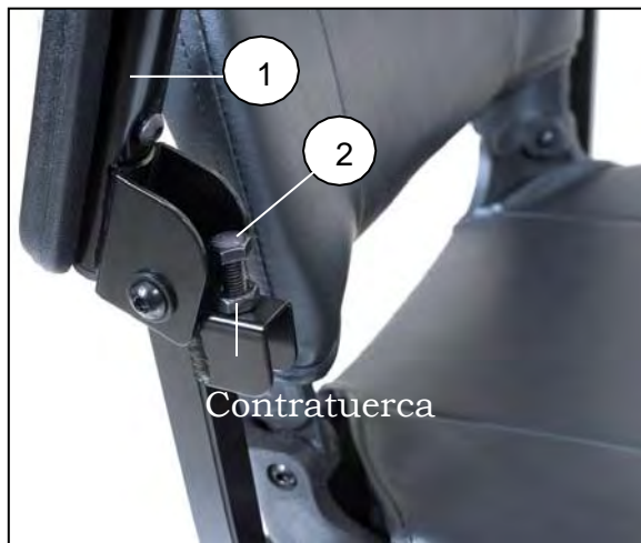
Imagen 6. Ajuste de anchura del reposabrazos