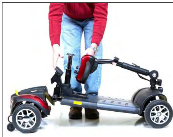
Imagen 17. Separando el tren de manejo y el armazón

9. Hale hacia arriba el armazón frontal y fuera del tren de manejo. Vea la imagen 17.