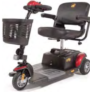
Imagen 24. Buzzaround XL™ (Modelo GB117SHD)