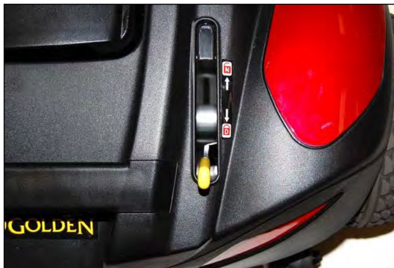
Imagen 11: Palanca rueda libre (En Drive)

Su Buzzaround XL™ está equipado con una palanca de rueda libre que puede establecer su scooter en o fuera del modo de rueda libre.