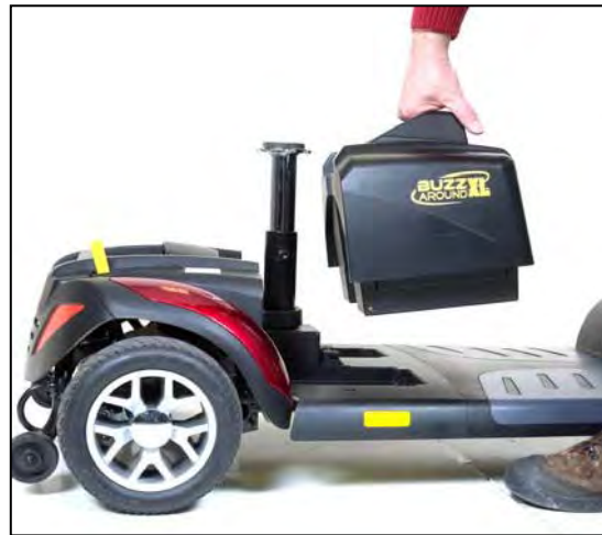
Imagen 15. Removiendo la batería