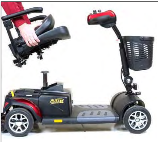
Imagen 14. Removiendo el asiento

3. Tome el asiento por el lado opuesto, y con un agarre firme; hale el asiento directamente hacia arriba. Vea la imagen 14.