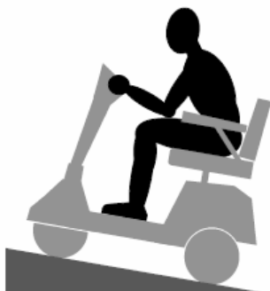
IMAGEN 2. SUBIENDO UNA CUESTA

* La inclinación máxima recomendada Del Buzzaround XL es de 6°