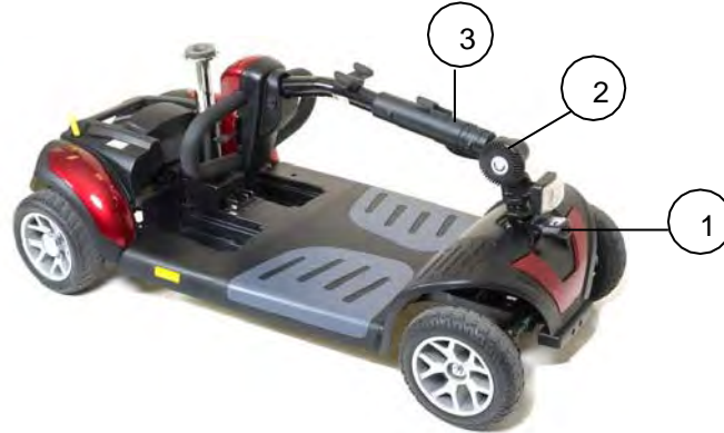
Imagen 16. Brazo del volante hacia abajo

6. Empuje hacia adentro y gire el brazo del volante hacia la derecha en 90 grados. vea el punto #1 en la imagen 16. Esto bloqueará las ruedas delanteras, evitando que se muevan de un lado a otro para tener un mejor control mientras se carga.