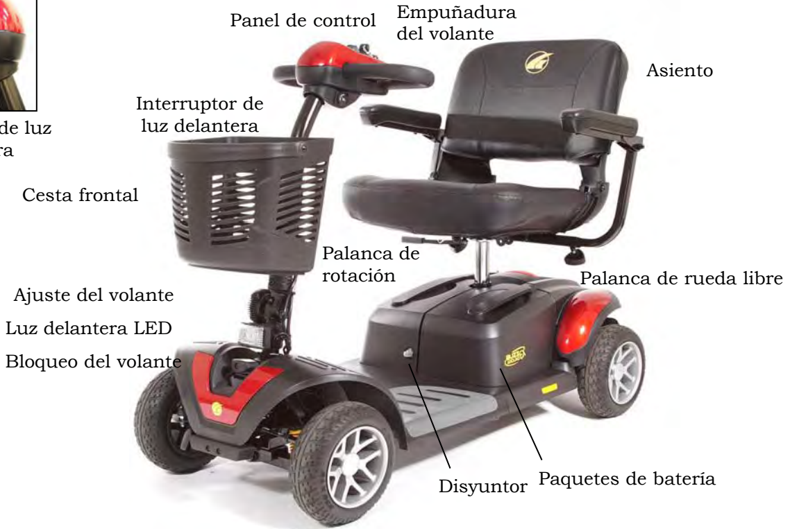
Imagen 4. Su Golden Buzzaround Extreme™ (Modelo GB148EX)