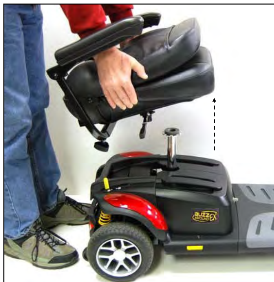
Imagen 14. Removiendo el asiento

3. Tome el asiento por el lado opuesto, y con un agarre firme; hale el asiento directamente hacia arriba. Vea la imagen 14.