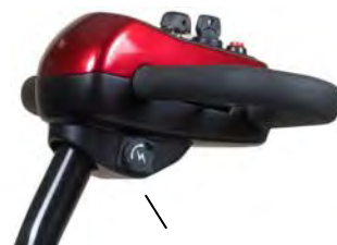
Puerto de carga

Nota: Su scooter no se moverá mientras el cargador permanezca conectado.