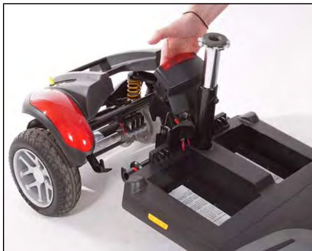
Imagen 17. Separando el tren de manejo y el armazón

9. Hale hacia arriba el armazón frontal y fuera del tren de manejo. Vea la imagen 17.