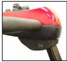
Interruptor de luz delantera