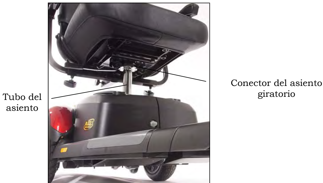
Imagen 23. Instalando el asiento