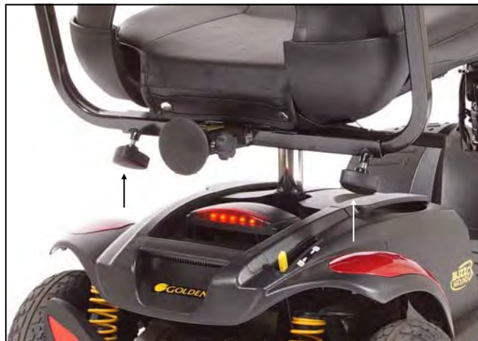
Imagen 6. Ajuste de anchura del reposabrazos

Para ajustar la anchura del reposabrazos: