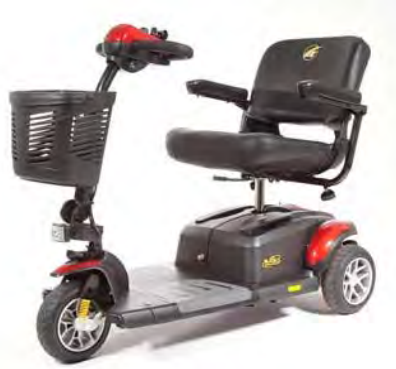
Imagen 24. Buzzaround Extreme™ (Modelo GB118EX)