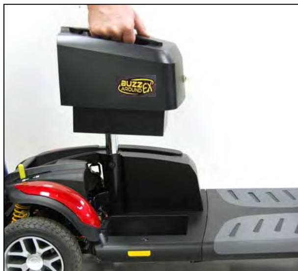
Imagen 21. Instalación de la batería