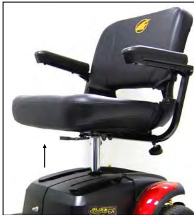
Imagen 8: Ajuste de rotación del asiento