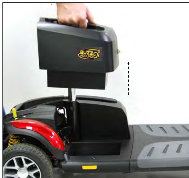
Imagen 15. Removiendo la batería