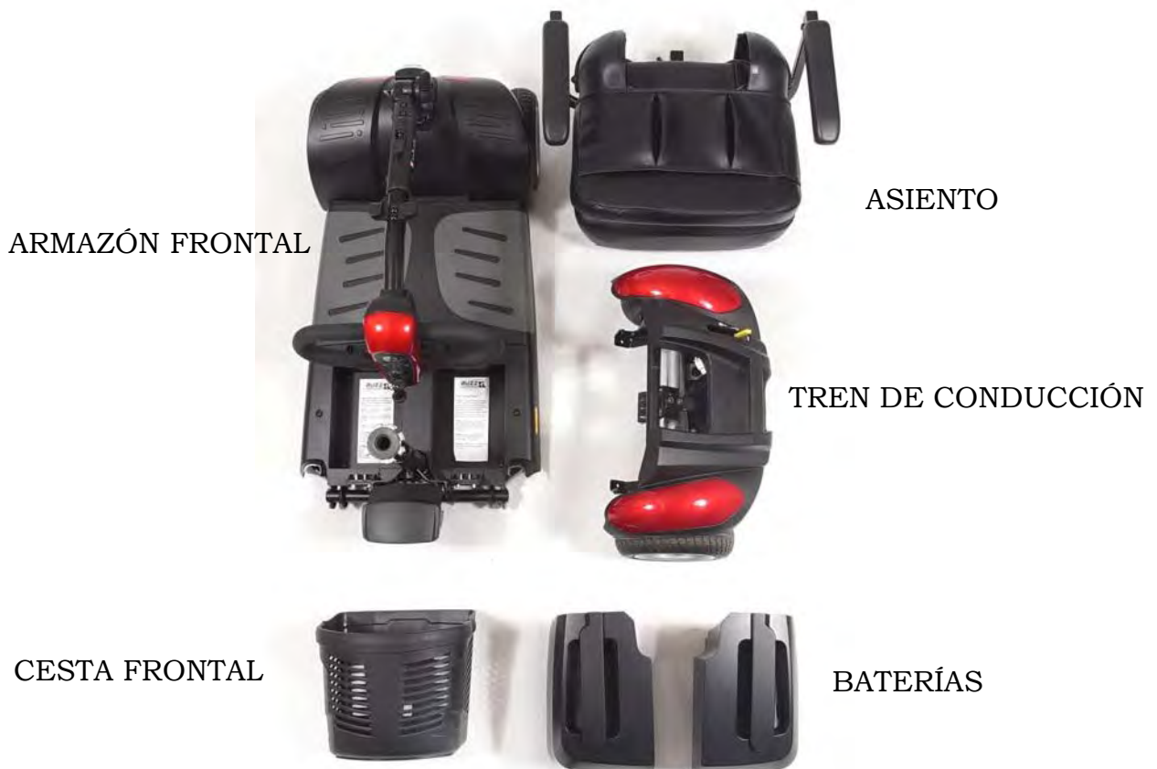
Imagen 18. Componentes del Buzzaround Extreme™ (Modelo GB148EX)

Asegúrese de que todos los componentes en el scooter hayan sido correctamente armados. Durante el montaje, por favor verifique que todos los positivos de conexión/bloqueo estén en su lugar.