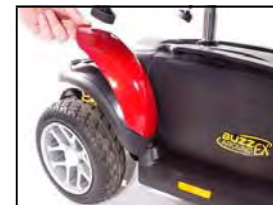
Imagen 1. Características del Buzzaround Extreme™ (Modelo: GB118EX)

Paneles de colores intercambiables: Ubicados en el guardabarros frontal y trasero del scooter. Los paneles estándar rojos y azules pueden ser cambiados rápidamente al presionar el panel hacia arriba desde el hoyo de acceso ubicado debajo de la cubierta de plástico.