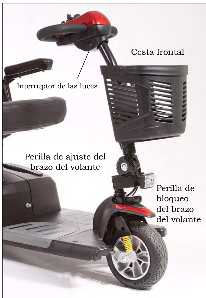
Imagen 22. Brazo del volante alzado