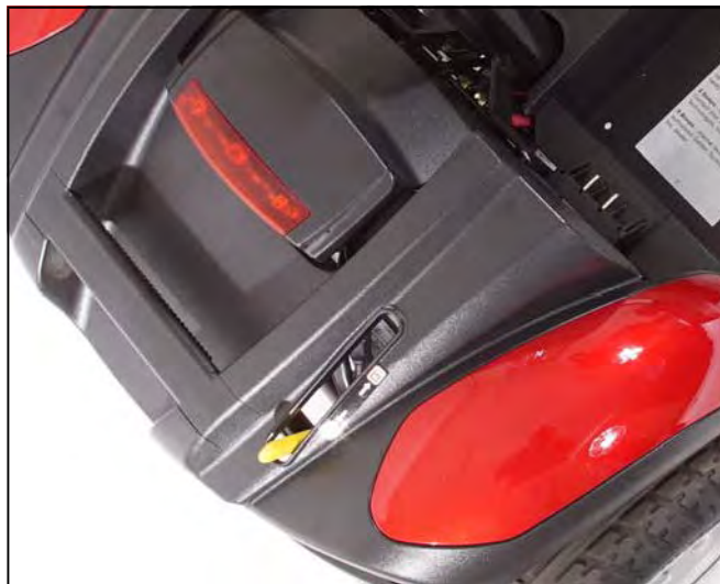
Imagen 11: Palanca rueda libre (En Drive)

Su Buzzaround Extreme™ está equipado con una palanca de rueda libre que puede establecer su scooter en o fuera del modo de rueda libre.